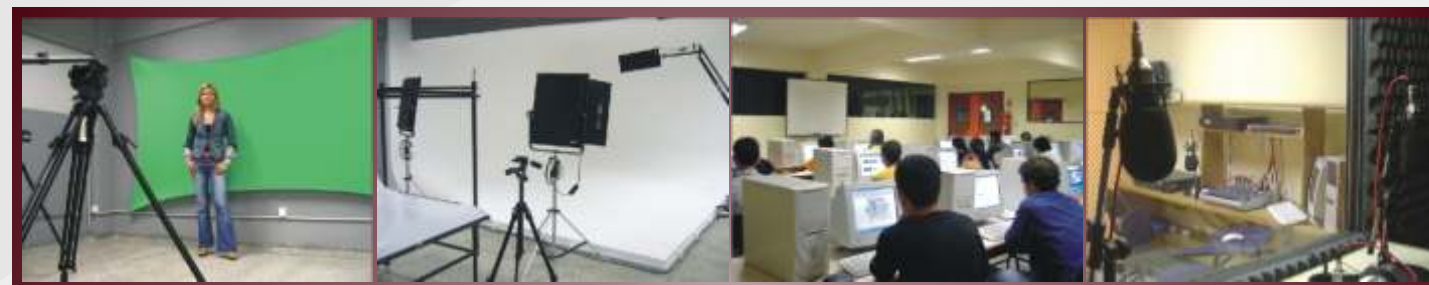
Estúdio de TV

Os empreendedores também contam com um laboratório de fotografia que possui os mais modernos equipamentos e amplo espaço para aplicação dos conhecimentos apreendidos em sala de aula; Laboratório de rádio para criação e produção de comerciais, jingles e outros materiais acadêmicos e profissionais. E ainda um laboratório e estúdio de TV, propiciando um maior aperfeiçoamento de nossos alunos para o mercado de trabalho.